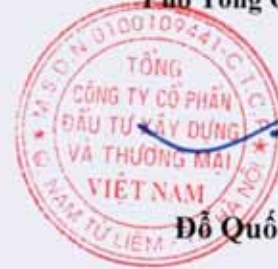
Đỗ Quốc Việt